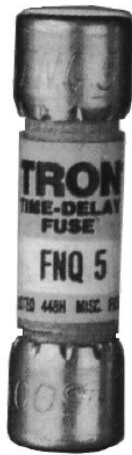
Foto del prodotto / Product image